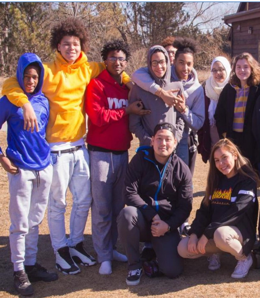
Des jeunes de partout au pays se rencontrent pour partager leurs apprentissages dans le cadre de l'initiative Les jeunes font cent